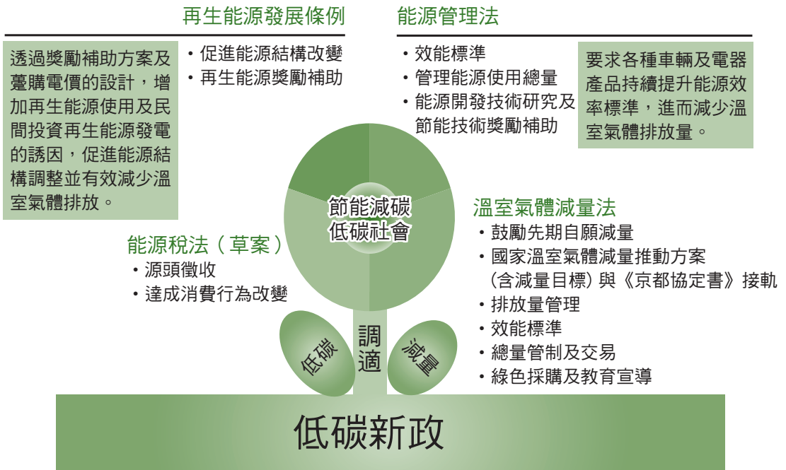
減碳四法互補性示意圖

1. 推動「節能減碳四法」，所謂的節能減碳四法，是節能減碳的立法政策工具，其內容乃指《再生能源發展條例》、《能源管理法》、《溫室氣體減量及管理法》與《能源稅法草案》四者。